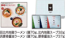
・秋田比内地鶏ラーメン(麺70g、比内地鶏スープ32g) ・横浜豚骨醤油ラーメン(麺70g、豚骨醤油スープ37g) ・尾道中華そば(麺70g、中華そばスープ36g) ・ラーメン用具材(ハートなるこ、小ねぎ、白煎りごま)×3袋

A-5 1万円 ＜UMAMI＞ご当地ラーメン D 【秋田比内地鶏・横浜豚骨醤油・尾道中華そば】