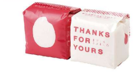
・新潟県南魚沼産コシヒカリ300g(2合)×2