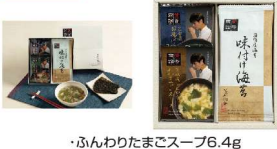
・ふんわりたまごスープ6.4g ・お揚げと小松菜スープ3.6g ・味付け海苔8切5枚