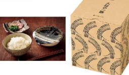
・包装米飯(白飯)160g×5(うるち米)