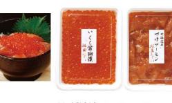
・いくら醤油漬120g×2 ・づけサーモン120g×3