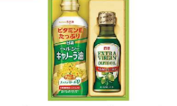
・日清ヘルシーキャノーラ油350g×1本・ 日清エキストラバージンオリーブオイル145g×1本