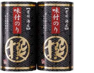
・味付のり8切12枚×2袋(板のり3枚分)×2

A-5 1万円 ＜UMAMI＞ご当地ラーメン D 【秋田比内地鶏・横浜豚骨醤油・尾道中華そば】