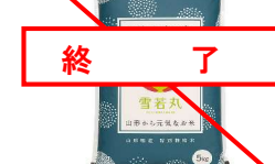
・特栽培培米雪若丸5kg×5