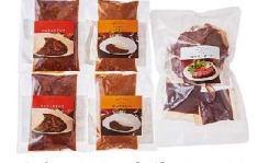
・ローストビーフ300g・デミグラスソース30g×2 ・ビーフカレー200g×2・ハッシュドビーフ200g×2