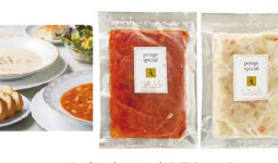
・ミネストローネ150g×6 ・クリームスープ150g×6