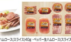
・生ハムロース(スライス)40g・ペッパー生ハムロース(スライス)40g ・あらびきソーセージ70g×2・あらびきウインナー100g ・ガーリックブルスト200g・炭火焼ベーコン(スライス)80g×2