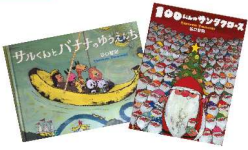
2冊セット ※写真の絵本とは限りません。