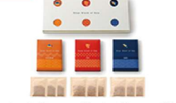
・かつおだし6g×3袋・あごだし6g×3袋 ・鰯だし5.2g×3袋