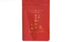
・八女星野和紅茶2g×15P