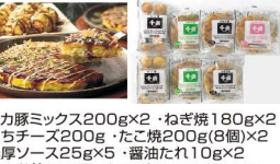
・イカ豚ミックス200g×2・ねぎ焼180g×2 ・もちチーズ200g・たこ焼200g(8個)×2 ・濃厚ソース25g×5・醤油たれ10g×2 ・かつお節1g×7・ホワイトソース10g×7 ・あおさのり0.2g×7