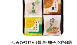
・しみかりせん(醤油・柚子)×各8袋 ・さがえ焼×7枚 ・野菜カレー煎餅5枚