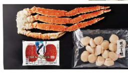
・ポイルたらばかに脚800g ・いくら醤油味100g・ほたて貝柱300g