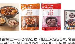
・名古屋コーチンおこわ(加工米350g、名古屋 コーチン入だし汁300g)×5・大納言お赤飯 (加工米350g、小豆煮汁250g、小豆30g、こ ま塩1.6g)×5・味噌おでん290g×5