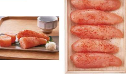
・大吟醸仕込辛子めんたいこ270g