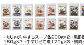
・肉じゃが・牛すじスープ各200g×2・黒酢豚豚 180g×2・牛すじと煮170g×3・鶏肉と茄子 のピリ辛炒め150g×2・ピリ辛筑前煮 130g×2・さばの煮付け100g×2