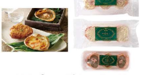
・かに甲羅グラタン(3個入)270g・かにみそ甲 羅焼(3個入)90g・かに甲羅揚げ(3個入)360g