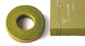
・抹茶バウムクーヘン1個(直径約13cm)