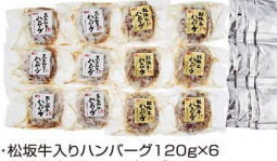
・松坂牛入りハンバーグ120g×6 ・黒毛和牛入りハンバーグ100g×6 ・ハンバーグソース20g×12