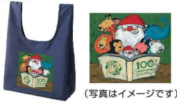
(写真はイメージです) 谷口智則先生×四條畷学園コラボ サイズ:360(持手含む550)×300×180(横マチ)mm