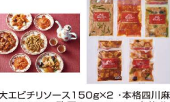
・大エビチリソース150g×2・本格四川麻婆豆腐 150g×2・酢豚150g×2・本格八宝菜 150g×2・青椒肉絲150g×2