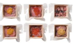
・若狭牛ローストビーフ(うに、いくら、すまいがに)各 50g×2・若狭牛ローストビーフ(黒トリュフ)45g×2