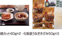
・蒲焼カット60g×2・化粧袋うなぎざきみ50g×3 ・吸い地(タシ)120g×3・山椒2袋 ・おろしわさび3袋・きざみりのり3袋・ホルルだれ150ml