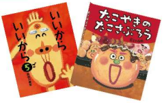
2冊セット ※写真の絵本とは限りません。