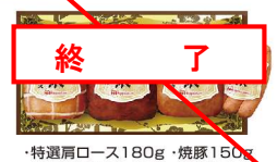
・特選肩ロース180g・焼豚150g ・あらびきミートローフ150g ・特選あらびきウインナー70g