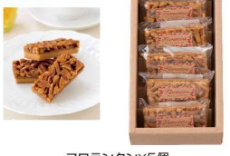
・フロランタン×5個