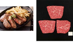
・モモステーキ(3枚)計240g